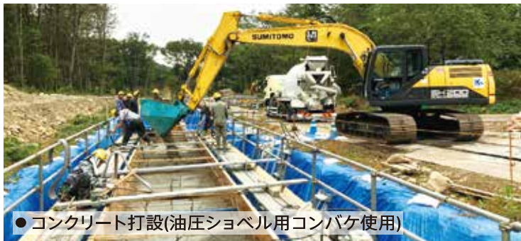
● コンクリート打設(油圧ショベル用コンバケ使用)