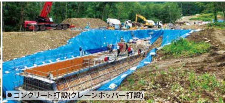
● コンクリート打設(クレーンホッパー打設)