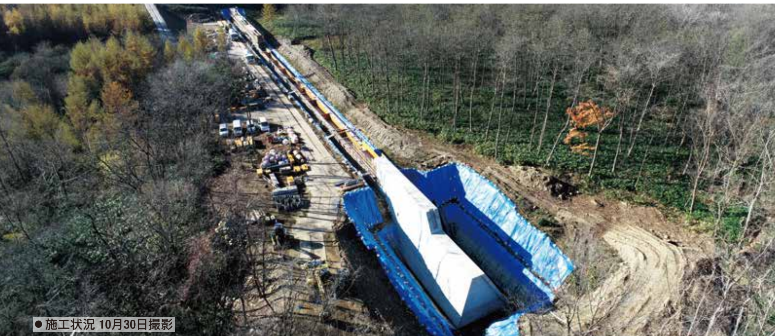
● 施工状況 10月30日撮影