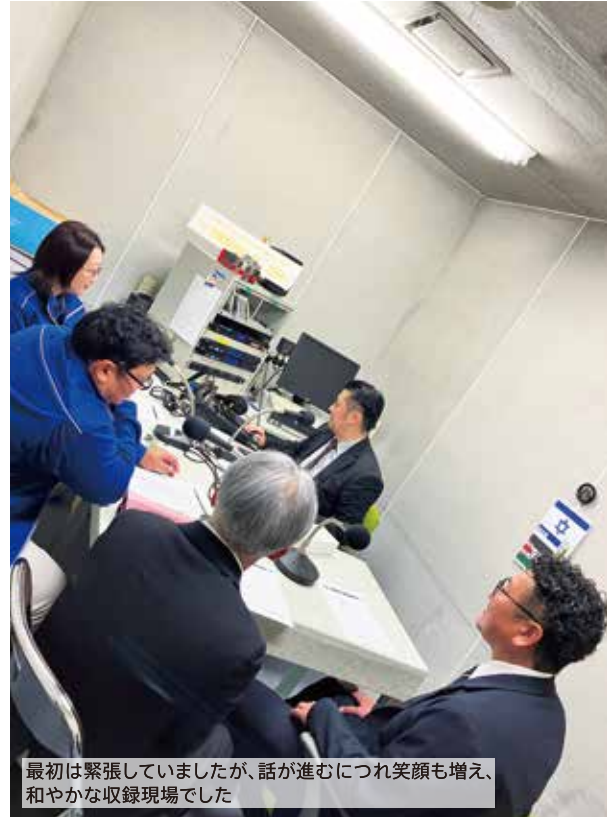
最初は緊張していましたが、話が進むにつれ笑顔も増え、和やかな収録現場でした

次回の放送は12月10日(火)です!ラジオでは、76.1MHzに合わせて。パソコンやスマートフォンでは「リスラジアプリ」からお聴きいただけます。ぜひ「HAGIWARA TIMES」をお手元にご用意のうえ20分間のトークを、どうぞお楽しみください!