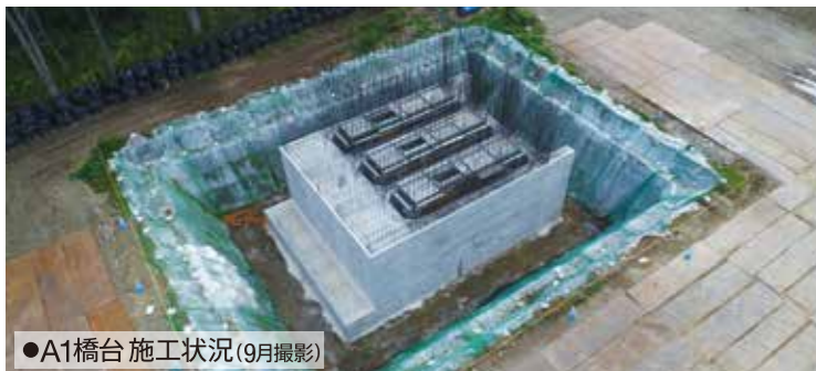
●A1橋台 施工状況(9月撮影)