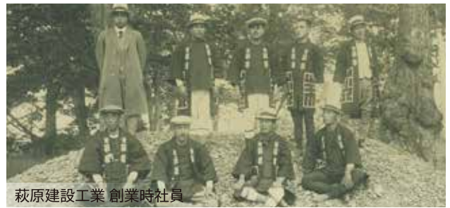
萩原建設工業 創業時社員