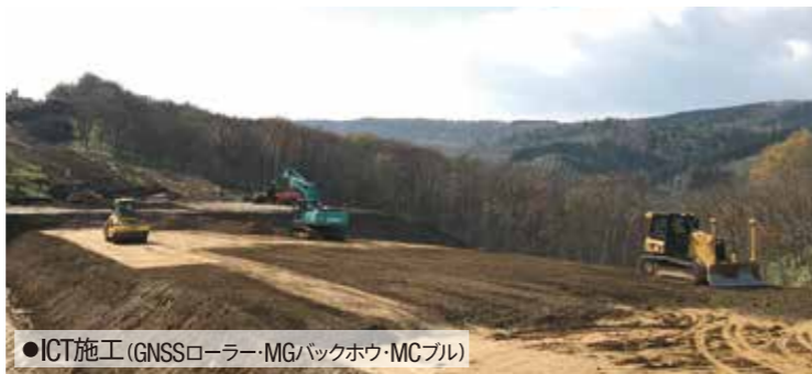
●ICT施工(GNSSローラー・MGバックホウ・MCブル)