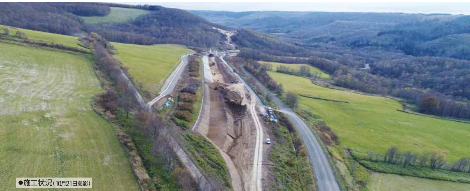
●施工状況(10月21日撮影)