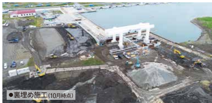
●裏埋め施工(10月時点)