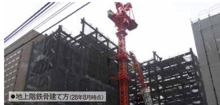
●地上階鉄骨建て方(28年8月時点)