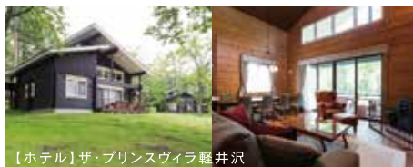
【ホテル】ザ・プリンスヴィラ軽井沢

大塚家具では世界に広がる工場ネットワークと得意分野を活かし、ホテルや店舗、医療施設、モデルルーム、客船の家具・内装、企業の応接室など、さまざまな環境の創造に携わっています。予算や品質などあらゆる面で幅の広いニーズに応じたご提案が可能です。