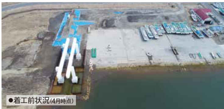
●着工前状況(4月時点)