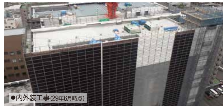
●内外装工事(29年6月時点)