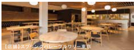
【店舗】スプリングバレーブルワリー東京