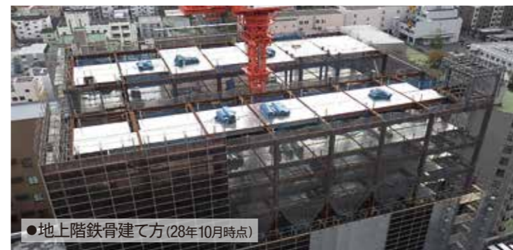
●地上階鉄骨建て方(28年10月時点)