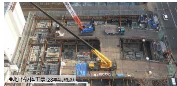
●地下躯体工事(28年4月時点)