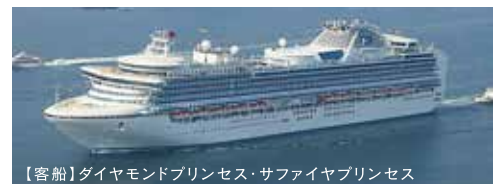
【客船】ダイヤモンドプリンセス・サファイヤプリンセス