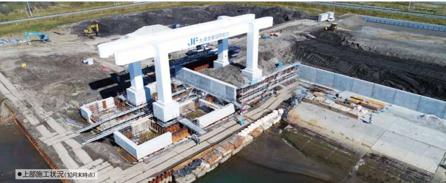
●上部施工状況(10月末時点)