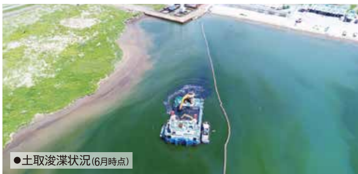
●土取浚渫状況(6月時点)