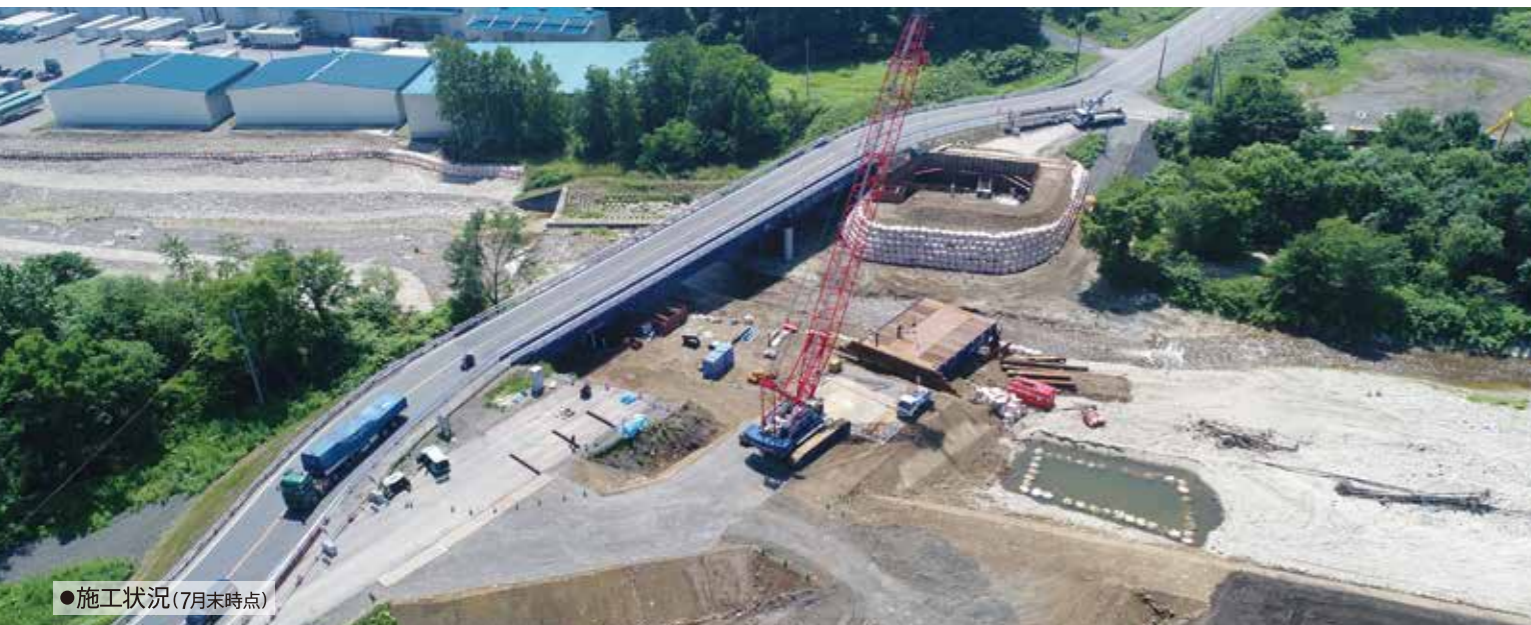
●施工状況(7月末時点)