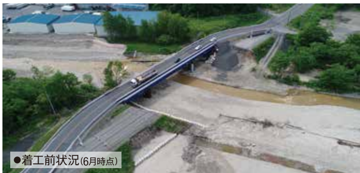
●着工前状況(6月時点)