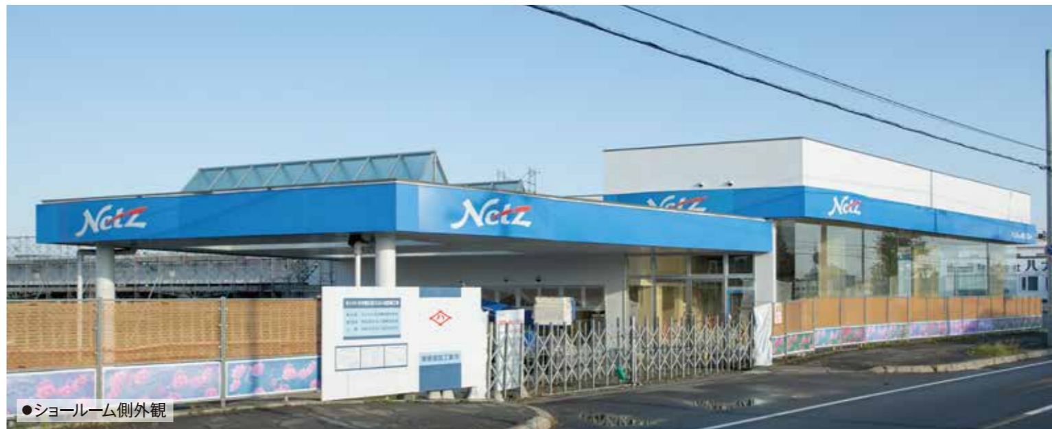
●ショールーム側外観