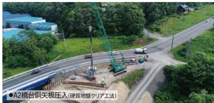
●A2橋台鋼矢板圧入(硬質地盤クリア工法)