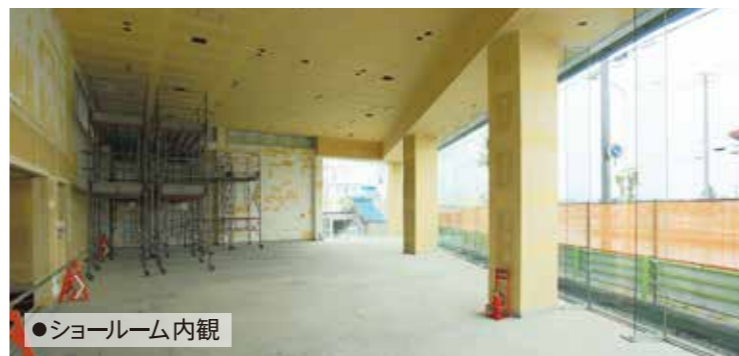
●ショールーム内観