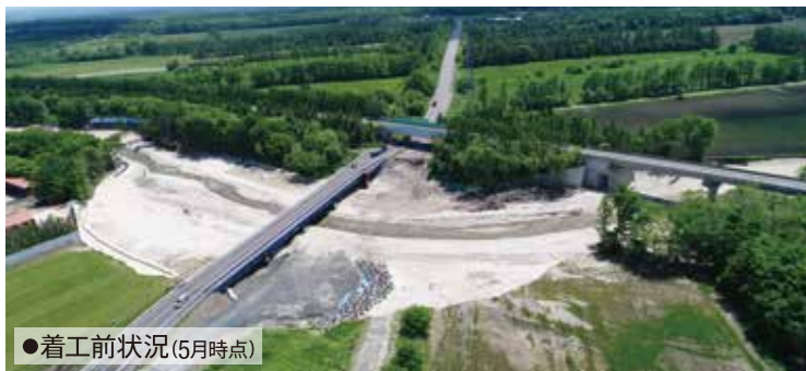
●着工前状況(5月時点)