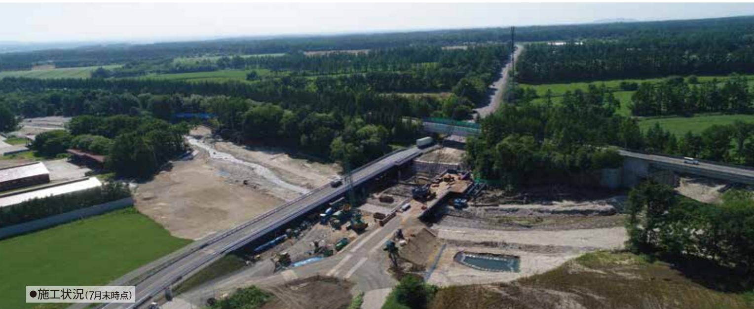
●施工状況(7月末時点)