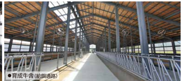
●育成牛舎(給餌通路)