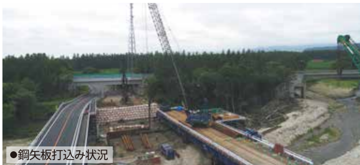
●鋼矢板打込み状況