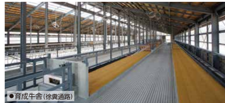
●育成牛舎(徐糞通路)