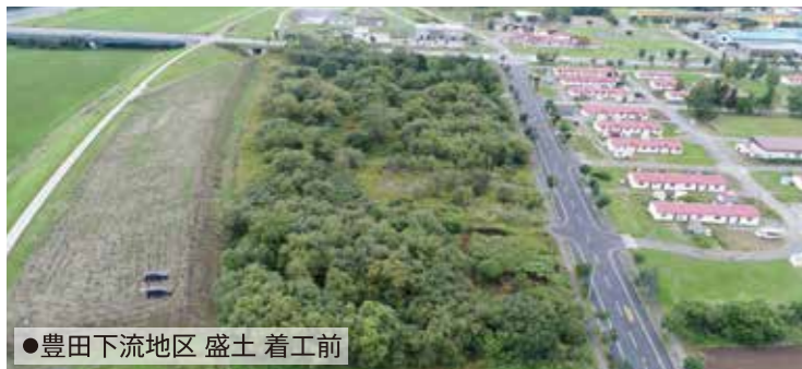
●豊田下流地区 盛土 着工前