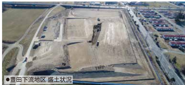
●豊田下流地区 盛土状況