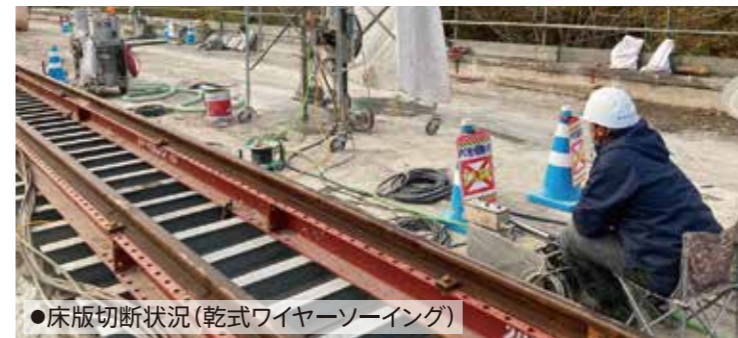
●床版切断状況(乾式ワイヤーソーイング)