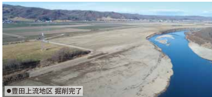
●豊田上流地区 掘削完了