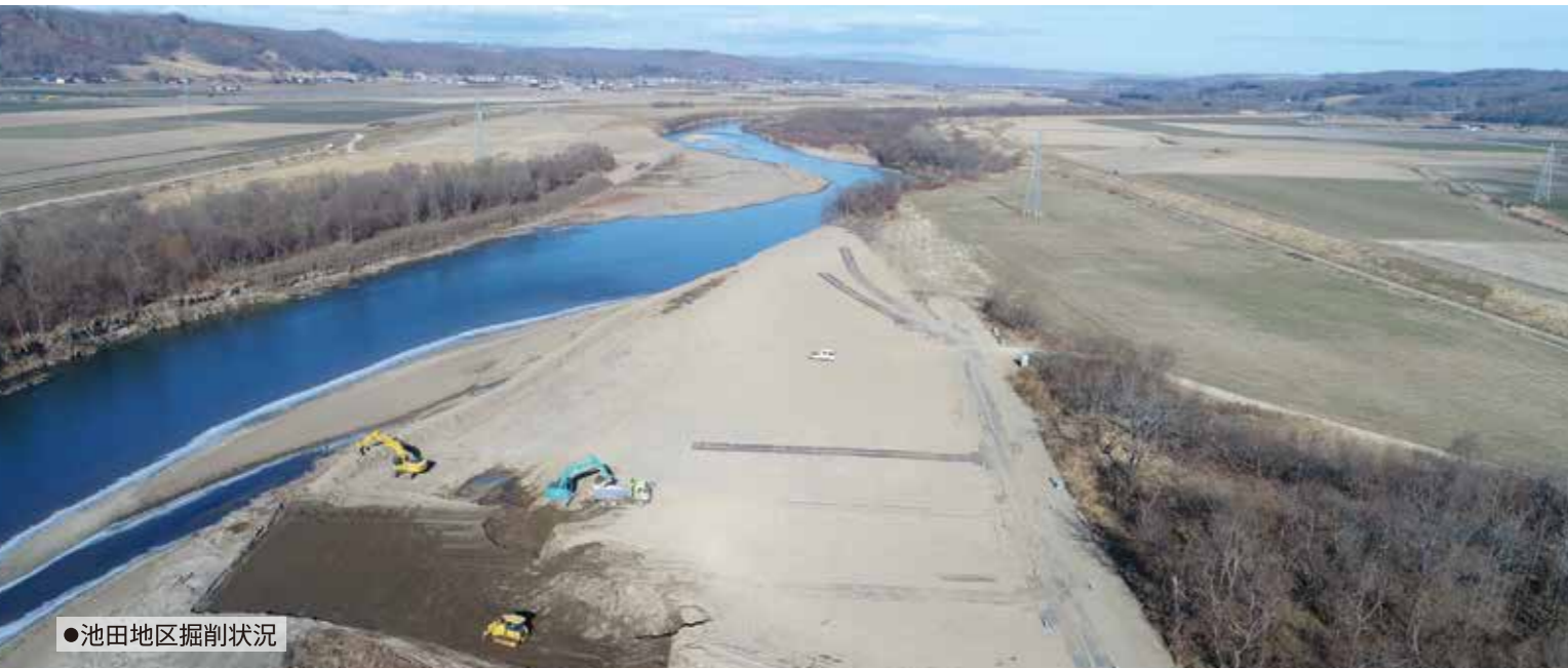
●池田地区掘削状況