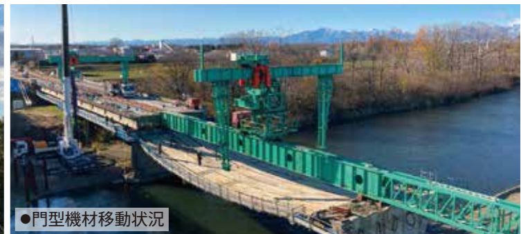
●門型機材移動状況