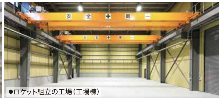
●ロケット組立の工場(工場棟)