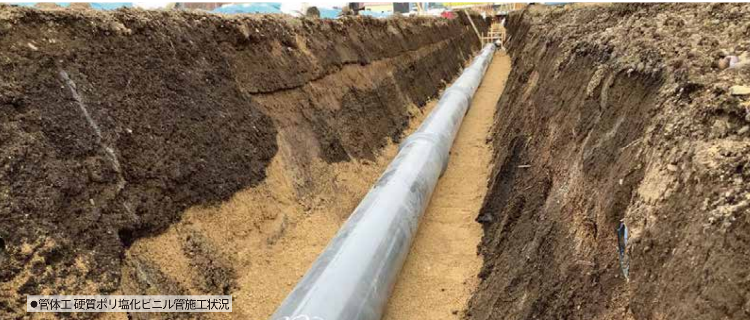
●管体工 硬質ポリ塩化ビニル管施工状況