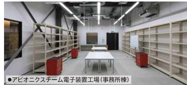
●アビオニクスチーム電子装置工場(事務所棟)