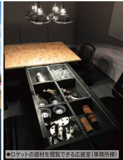
●ロケットの部材を閲覧できる応接室(事務所棟)