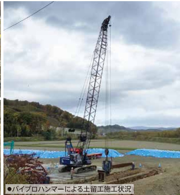
●パイロハンマーによる土留工施工状況