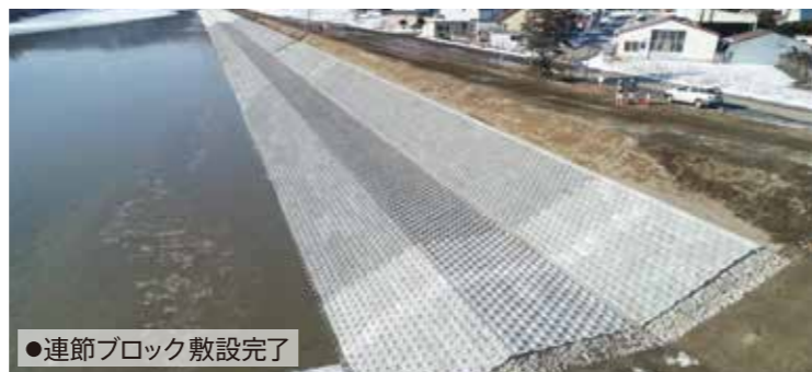
●連節ブロック敷設完了