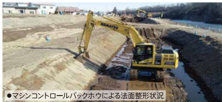
●マシンコントロールバックホウによる法面整形状況