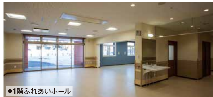
●1階ふれあいホール