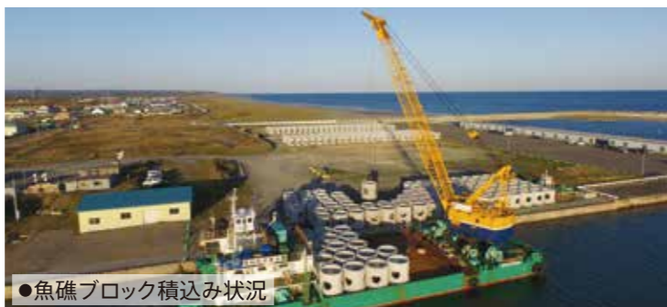
●魚礁ブロック積み込み状況