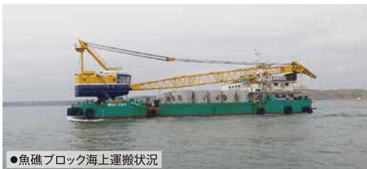
●魚礁ブロック海上運搬状況