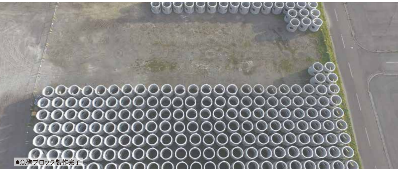
●魚礁ブロック製作完了