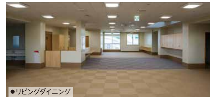
●リビングダイニング