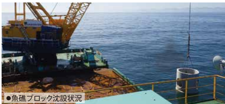
●魚礁ブロック沈設状況