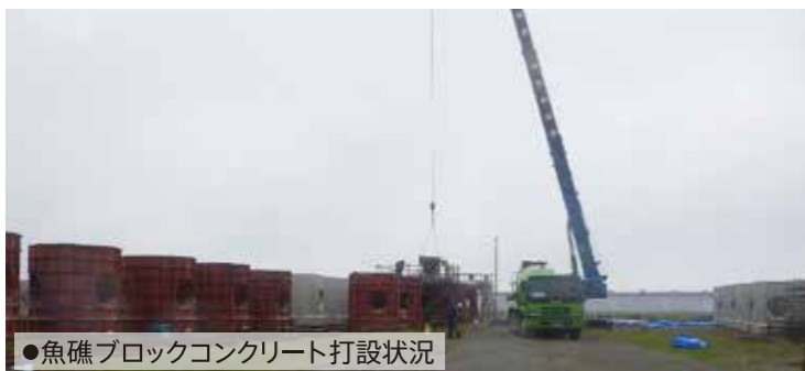
●魚礁ブロックコンクリート打設状況