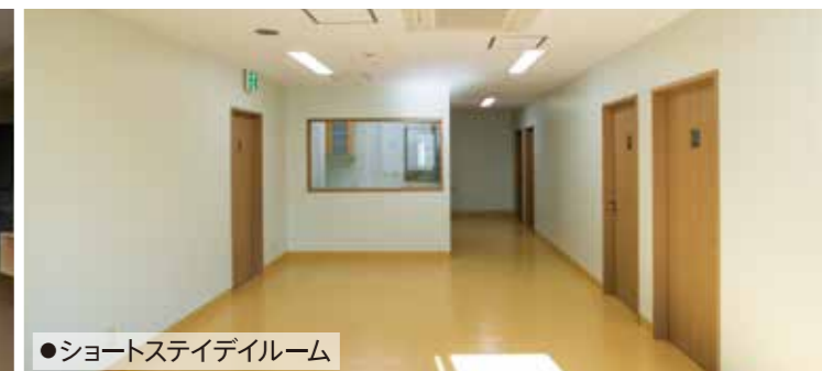
●ショートステイデイルーム