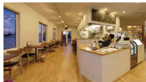
shop 2: こかげのカフェ