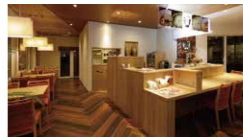
shop 3: ターブルベジ