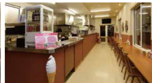
shop 4: とん風