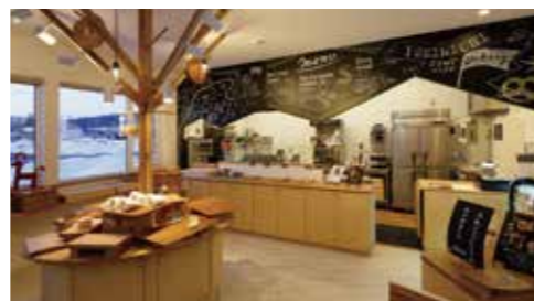
shop 1: よりみちベーカリー