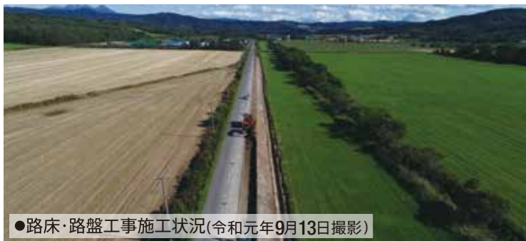
●路床・路盤工事施工状況(令和元年9月13日撮影)