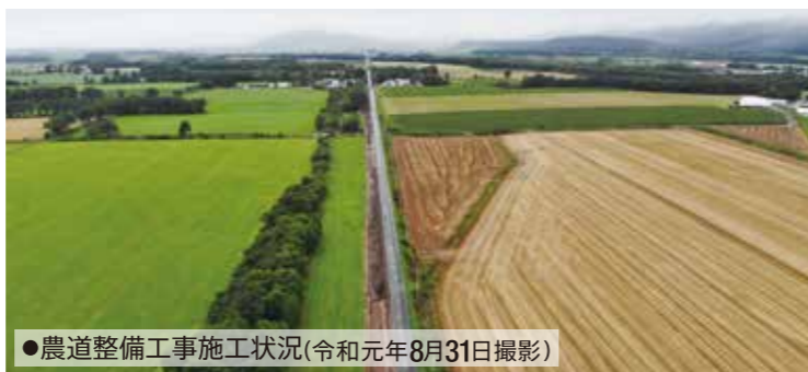
●農道整備工事施工状況(令和元年8月31日撮影)