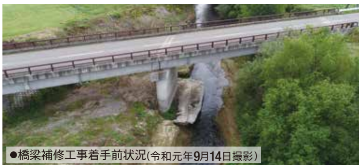
●橋梁補修工事着手前状況(令和元年9月14日撮影)