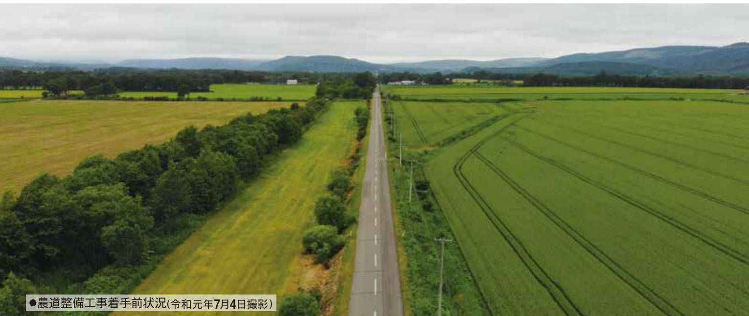
●農道整備工事着手前状況(令和元年7月4日撮影)