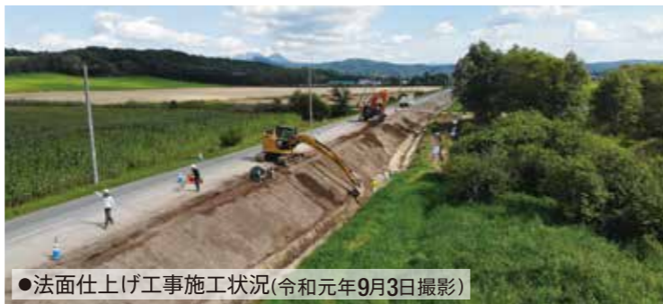
●法面仕上げ工事施工状況(令和元年9月3日撮影)