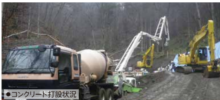
●コンクリート打設状況