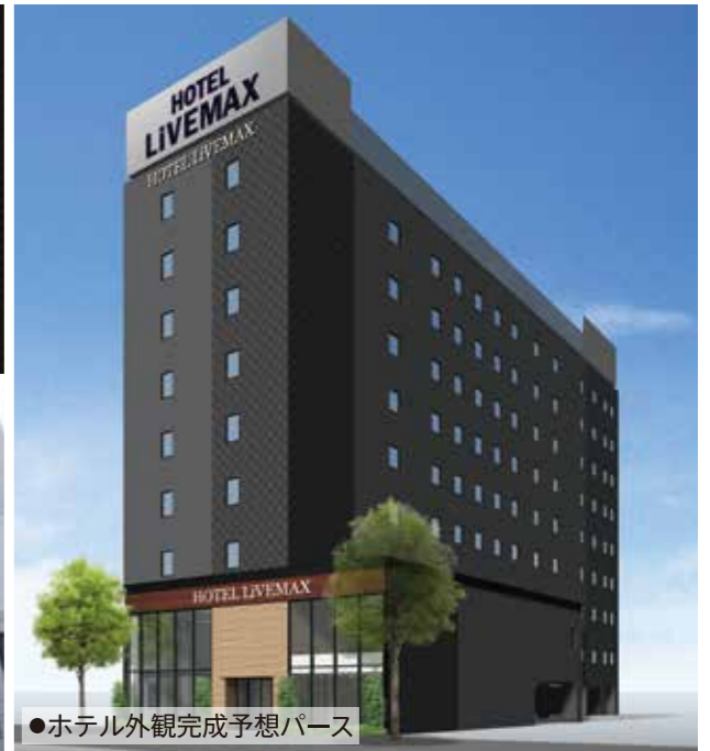
●ホテル外観完成予想パース