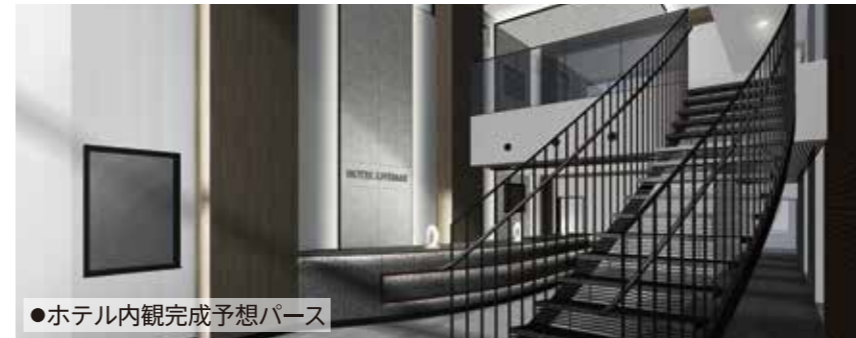
●ホテル内観完成予想パース