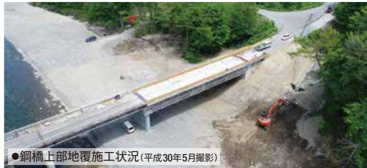
●鋼橋上部地覆施工状況(平成30年5月撮影)