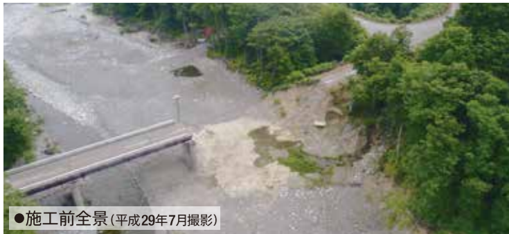
●施工前全景(平成29年7月撮影)