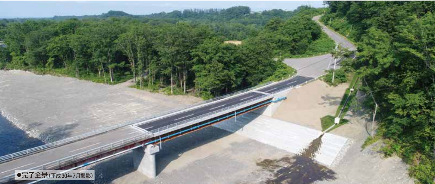
●完了全景(平成30年7月撮影)