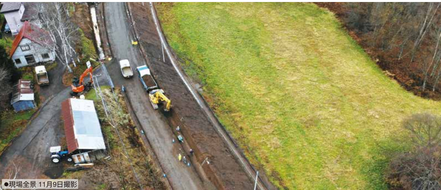
●現場全景 11月9日撮影