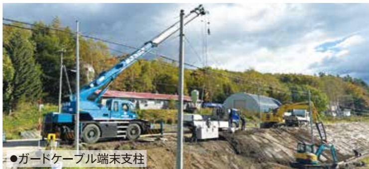
●ガードケーブル端末支柱