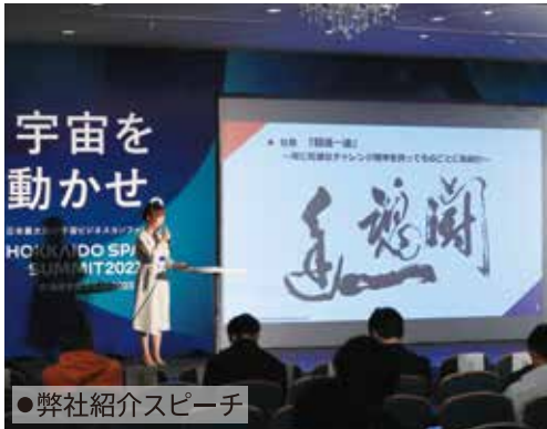
●弊社紹介スピーチ