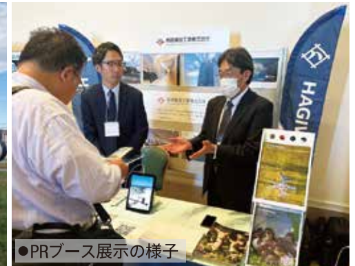
●PRブース展示の様子

令和5年10月12日(木)、今年で3回目となる日本最大級の宇宙ビジネスカンファレンス『北海道宇宙サミット2023』が「宇宙を動かせ。」をテーマに帯広市で開催され、約800人の関係者が来場しました。